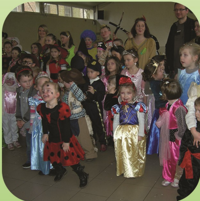
Carnaval des enfants