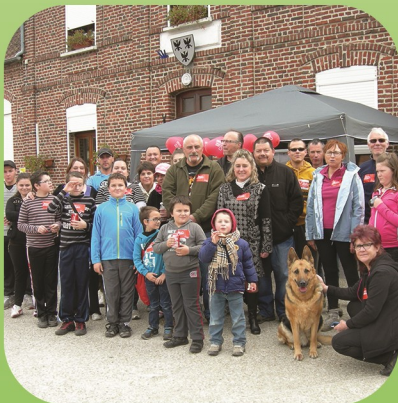
Parcours du coeur : Dimanche 6 avril